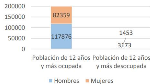
Gráfica 8 Población de 12 años y más económicamente activa

“En la actualidad, dos de cada cinco jóvenes en edad de trabajar o están desempleados o tienen empleo, pero no ganan lo suficiente para escapar de la pobreza. La trampa de la pobreza de los trabajadores afecta a tantos como 169 millones de jóvenes. En los países de bajos ingresos, la situación es aún peor, nueve de cada diez jóvenes siguen ocupando un empleo informal, que es esporádico, mal remunerado y no está protegido por la ley” Guy Ryder, director general de la OIT. La tasa de desempleo del Estado de Nuevo León nos muestra un panorama actualizado de cómo esta problemática ha aumentado del 2019 al 2020 Es por ello que durante los próximos años enfocaremos nuestra política de fomento económico al espíritu emprendedor, el empleo y el autoempleo. A pesar de todo lo anterior, de acuerdo con el Índice de Ciudades Prósperas (CPI) publicado en el 2018 por ONUHábitat, en su apartado de Productividad, San Nicolás tuvo una evaluación de 65.89, lo que representa que la proporción de la población que se encuentra desocupada, respecto a la población económicamente activa el índice es bajo.